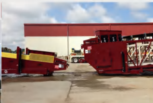
低型和标准型接料斗