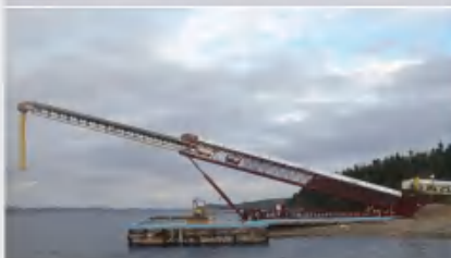
36"x170' 伸缩摆动式输送机